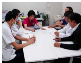
カンファレンス中のメンバー

24時間稼働してある病院において、その中で働く職員は夜間勤務などがあり、体内時計の乱れが生じます。それに加え肉体的・精神的な疲労が合わさることで、本来の意味とは違う勝手な解釈をし、思い込みをしてしまう場合があります。そういった悪条件が重なった時にエラー発生の可能性が高くなります。