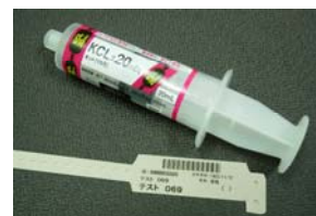
対策済シリンジとリストバンド

現在、我々は「ひとりのヒヤリはみんなのヒヤリ」をスローガンに、下記の4点を重点的に取り組んでいます。