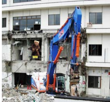
巨大な重機で病棟解体中

なお、仮設通路のご利用に当たっては、車椅子を通路の両出入口に設置しておりますので、お気軽にご利用ください。