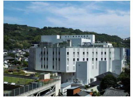
北側から見た新病棟

設置しています。また、新しい市立病院は、将来予想されている地震に備えるため、免震構造といった特別な配慮をしております。