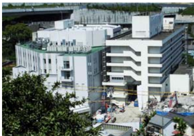
今は新旧病棟が並んだ状態

ご不便を来している状況でした。また、将来発生が予測されている南海・東南海地震に備えるためにも新病院建設は必要不可欠となりました。