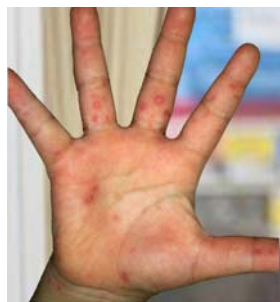
こんなブツブツが出てきます

変な病名の「手足口病」って、聞かれたことのある方も多いかと思います。英語でも「Hand-Foot-Mouth disease」と直訳で同じなんです。