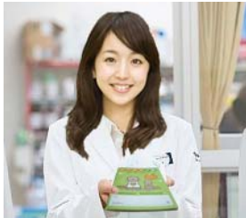
当院のお薬手帳です

お薬手帳とは、あなたが「いつ」「どこで」「どんな薬を」処方してもらったかを記録しておく手帳のことです。病院・薬局では、薬の名前、薬の飲み方・飲む量(使い方、使う量)、薬の注意事項、処方した医療機関名、処方日などを記入します。複数の医療機関を受診する時や転居した時など、お薬手帳を見せるだけであなたのお薬のことを伝えることができます。